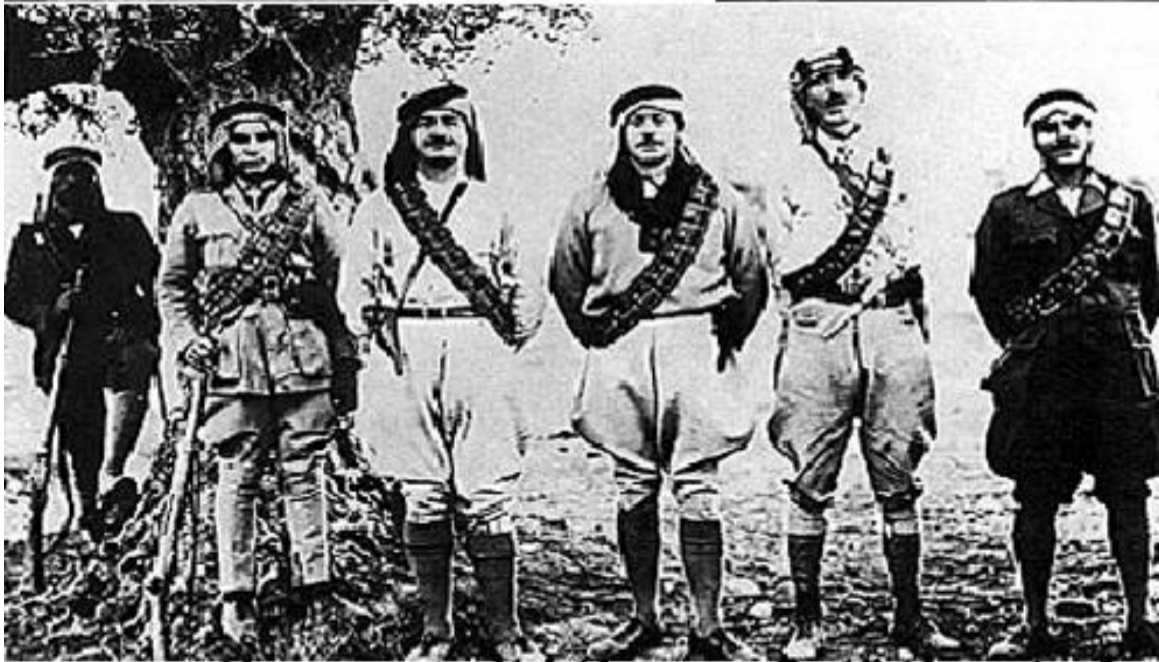
فوزي القاوقجي، الثالث من اليمين