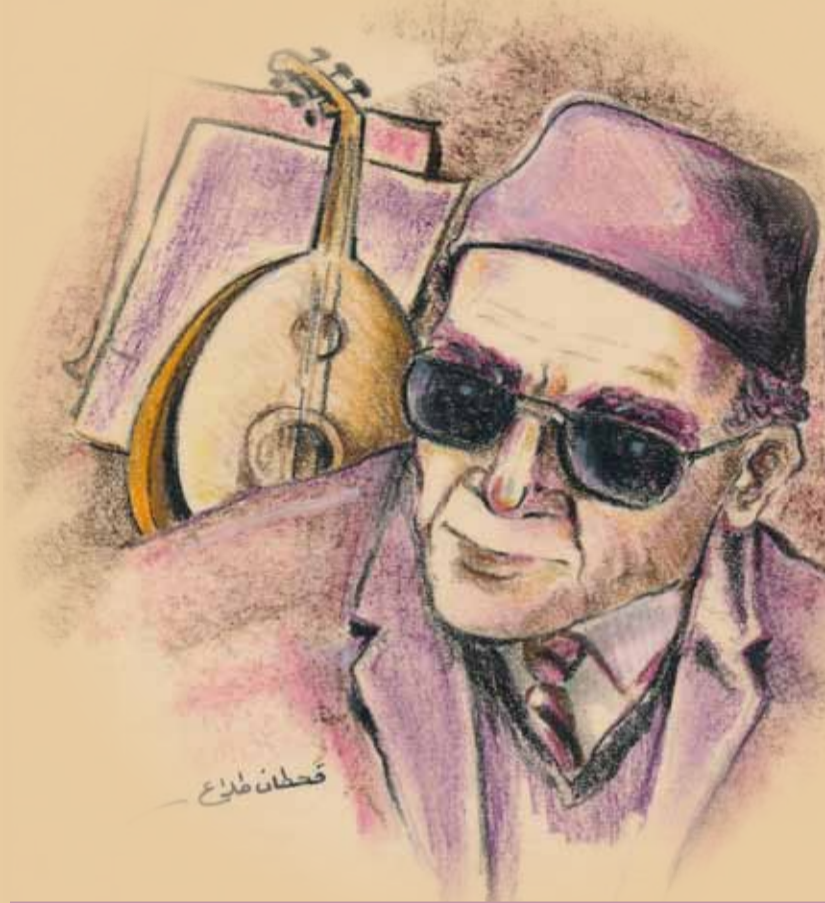
لوحة الشيخ إمام (خاصة) من عمل التشكيلي السوري قحطان طلاع رسمها في شتاء عام ١٩٨٦ بألوان الطباشير.

أصحاب المصلحة الحقيقية في يسار ثوري ينتصر لهم.