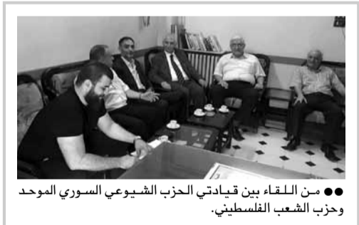
● من اللقاء بين قيادتي الحزب الشيوعي السوري الموحد وحزب الشعب الفلسطيني.

كيف ننضع الخطط الخاصة بإعادة إعمار سورتنا بعد تداعيات الأزمة والحصار والغزو الإرهابي، وهي خطط تحتاج إلى قدرات استثنائية، إذا كنا حتى اليوم عاجزين عن إيجاد حل لمشكلة التنقل في دمشق والمدن الكبرى؟ هل بات الأمر مستحيلاً أيها السادة في حكومتنا؟ أم سنظلون اليوم وعوداً أخرى تصاف إلى عود الحكومات السابقة؟!